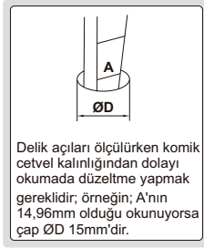
delik açığı ölçümü