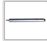
uzatma çubuğu (dahil)